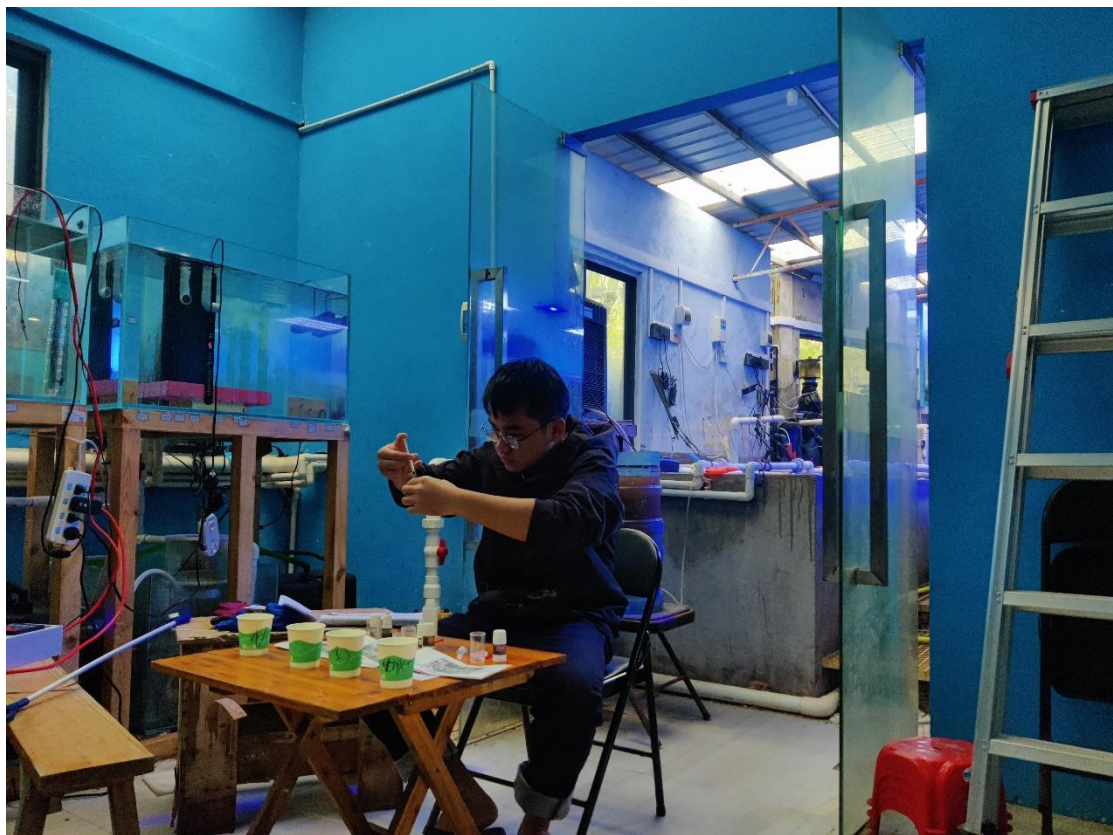
工作人员在检测养殖缸水质