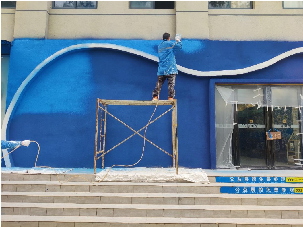
工人在对珊瑚馆门头进行喷漆作业