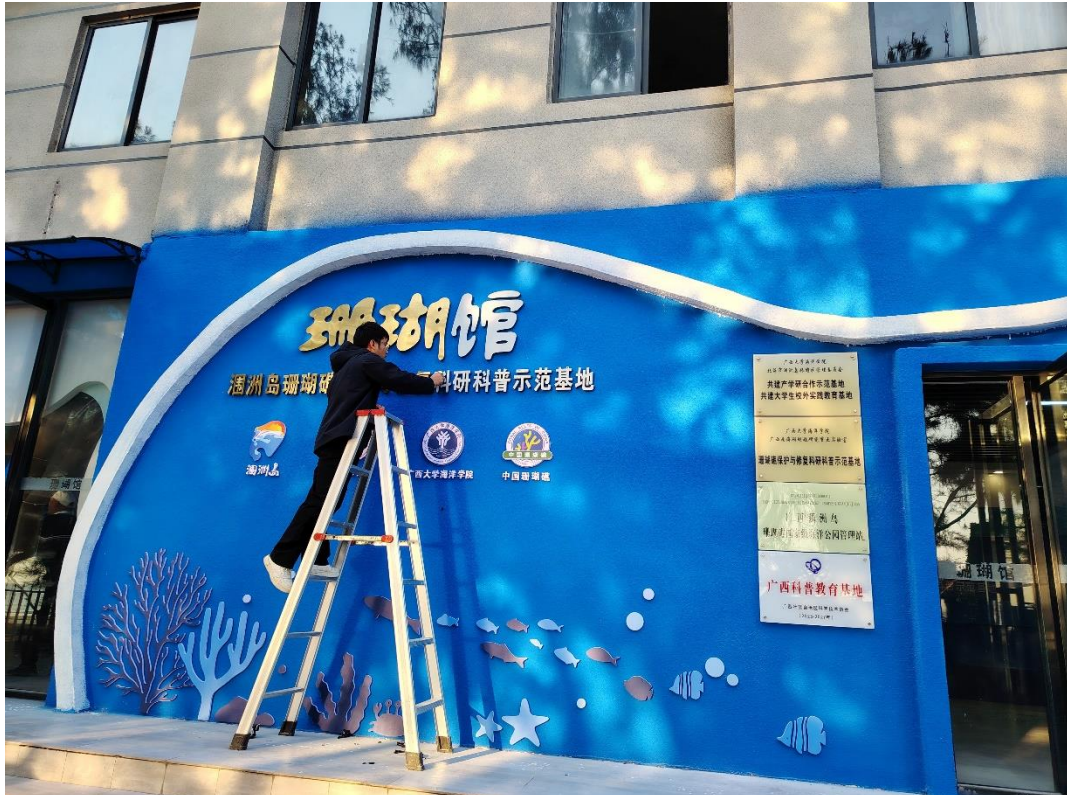
工作人员在安装门头牌匾和对珊瑚馆 logo 进行清洁工作