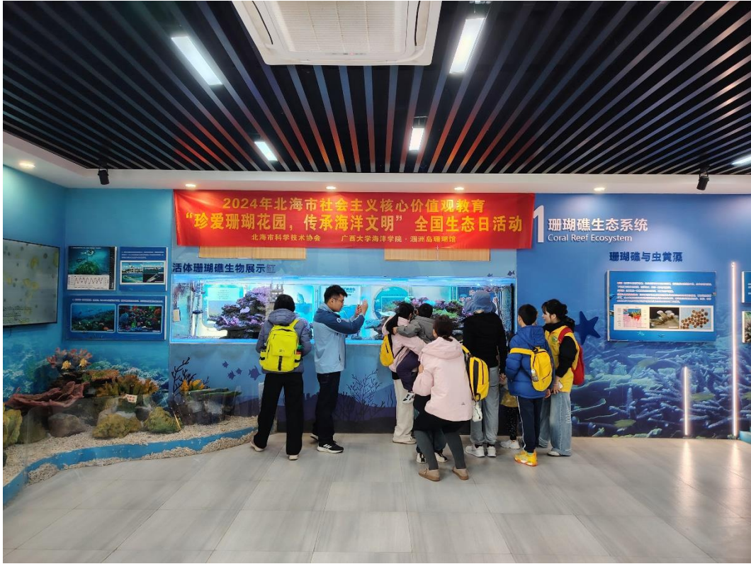
12月30日开展珊瑚认养研学活动