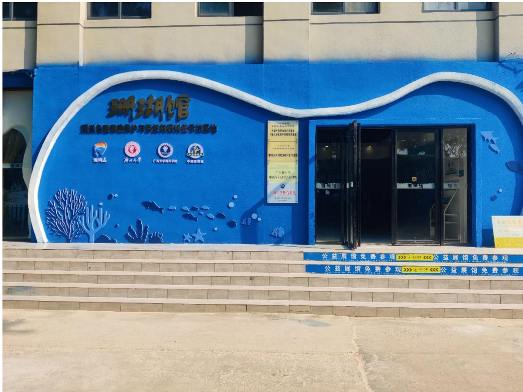
翻新以后的珊瑚馆门头照片

2024年12月，珊瑚馆电子设备运行正常，珊瑚馆养殖设备和管道维护运行正常。本月因电网电路故障停电两次。本月的场馆维护主要工作是对珊瑚馆的门头进行重新喷漆和珊瑚馆 logo 安装，同时清除馆内墙体老化导致的腻子脱落。