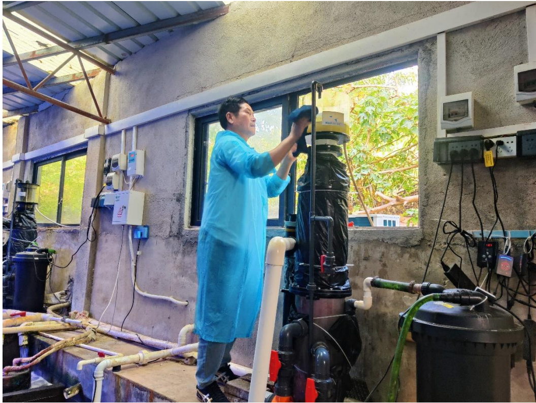
工作人员在清洗蛋白质分离器