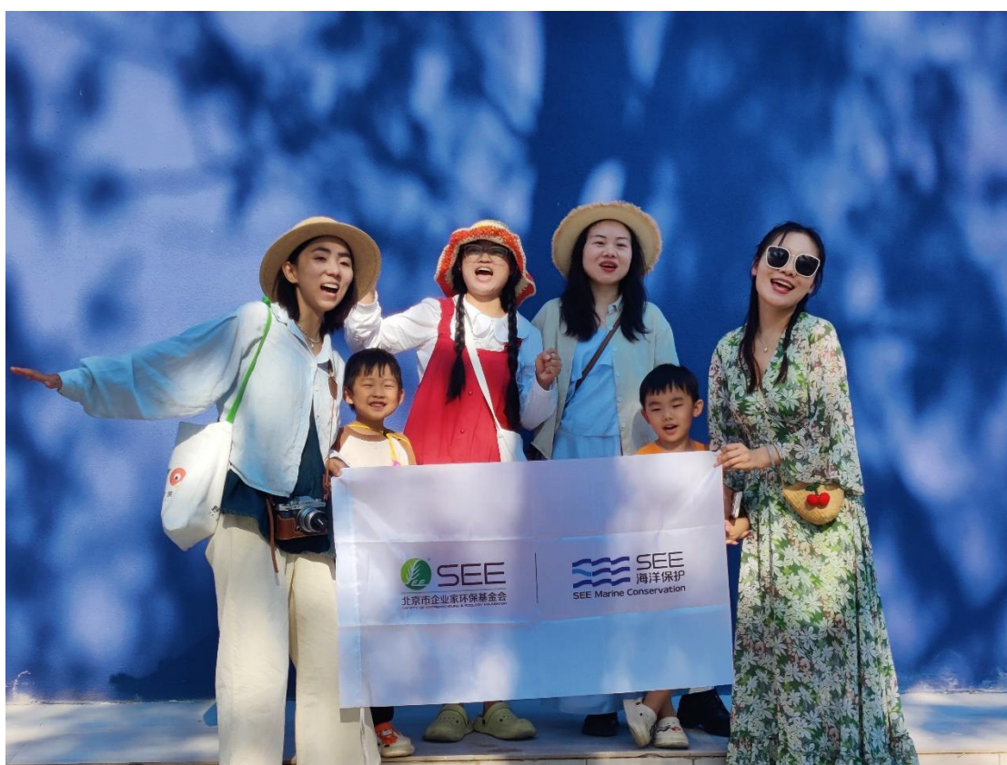
12月4日开展珊瑚认养研学活动

2024年12月面向社会公益开放参观25天，共有3779人次进馆参观。接待研学活动3次，受众45余人；公益讲解活动4次，受众84余人。