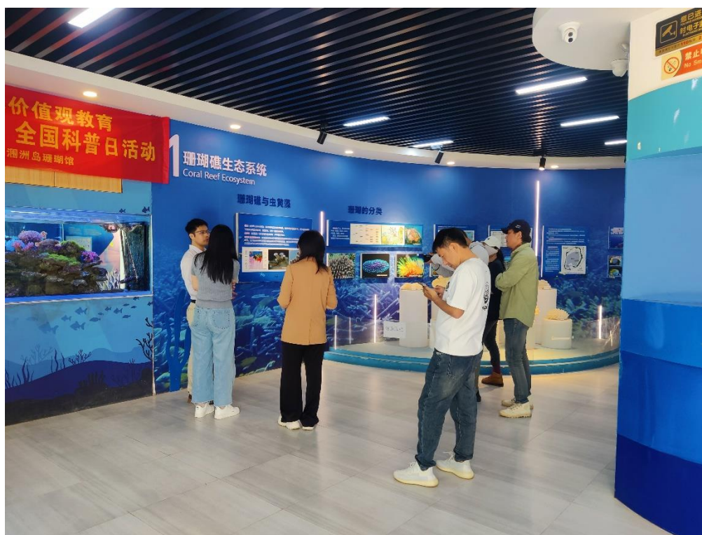
12月4日广西广播电视台都市频道等来馆录制直播素材